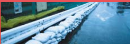
写真2. 草野水路の土嚢 ('13/10/25撮影 国道14号線)